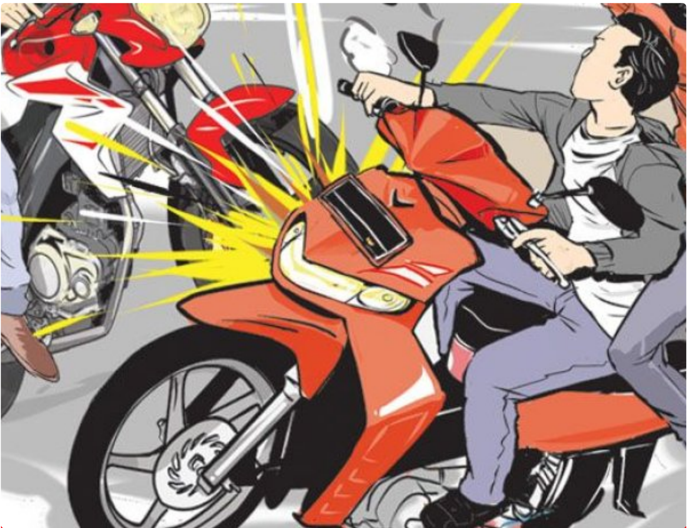
Ilustrasi laka lintas

BANYUWANGI - Dua unit sepeda motor mengalami kecelakaan lalu lintas adu banteng di Jalan Raya Jember, Desa Tulungrejo, Kecamatan Glenmore, Kabupaten Banyuwangi, Jawa Timur. Lakalantas yang melibatkan sepeda motor